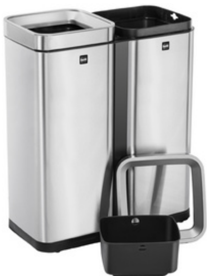
Edelstahl-Abfalltrenner "the twin bin"